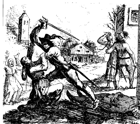
Szene aus dem 30jährigen Krieg