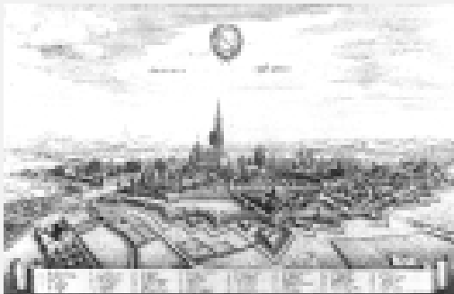
Ansicht von Straßburg nach Matthäus Merian 1644

Straßburg war ursprünglich eine von einem Bischof regierte Stadt. Zur Zeit der Romanhandlung war es freie Reichsstadt. Die Bürger konnten ihre Angelegenheiten eigenständig regeln. Die Stadt war nur dem König/Kaiser unterstellt.